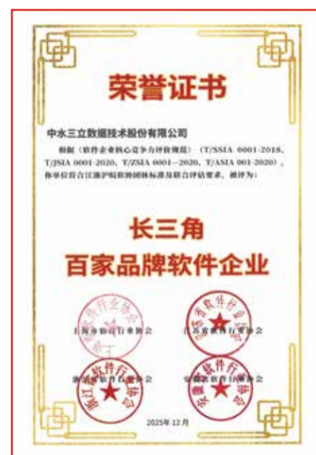
素材提供：企业发展部 吴静

未来，中水三立将持续加大研发投入力度，聚力打造更多引领行业发展的标杆性成果，为长三角软件产业的蓬勃发展注入创新动能。